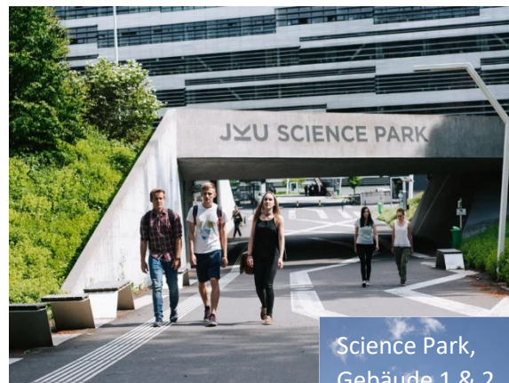
Science Park, Gebäude 1 & 2